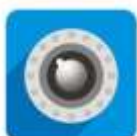
iSmartViewPro App アイコン